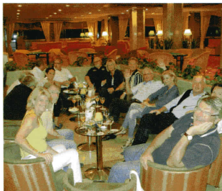
Unsere Golfrunde beim Begrüßungsangria im ****Hotel Palmira