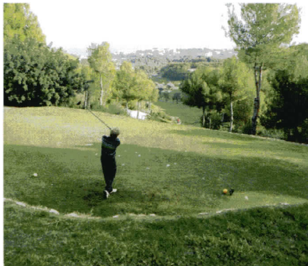
Sportlich äußerst anspruchsvoll war der Golfkurs Bendinat in der Nähe des Flughafens für unsere 8 Dauergolfer noch vor dem Heimflug.