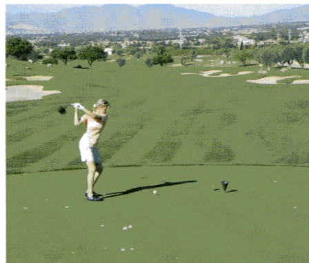
Golferlebnis auf höchstem Niveau am bestgepflegten Golfkurs Son Gual