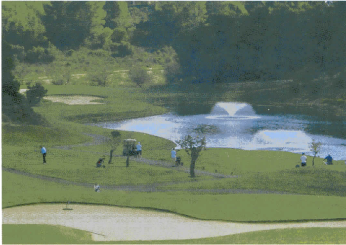
Der Golfplatz Son Quint mit 2 großzügigen Seen verlangte Konzentration und präzises Spiel.

Das Beste zum Schluss: Club de Golf de Poniente, verfügt über eines der schönsten landestypischen Clubhäuser und der Kurs ist perfekt in die bestehende Landschaft integriert. Breite, offene Fairways mit weitläufigen Greens und die Fauna spiegelt die heimische Pflanzen- und Baumwelt wider;