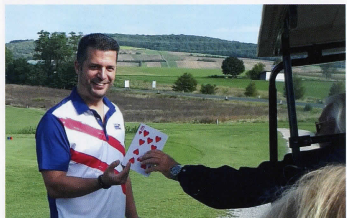
Lustige Überraschungen auf jedem Loch